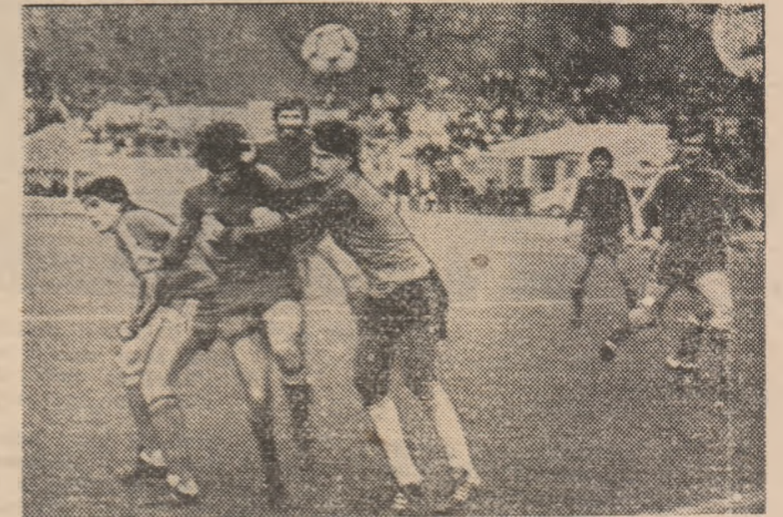
Dragnea reia cu capul mingea centrală de Văetuș, marcînd al doilea gol al dinamoviștilor.

Mureșan, Ionită, Porățchi, Roșu, Cătașos și Vidican); F.C. BIHOR: Albu — Nițu, Bigan, Rozsa, Kiss — Grosu, Pușcaș, Biszok, Kun II — Dianu, Nedelcu (au mai fost folosiți: Balazs, Pavel, He, Mureșan și Filip). (I. LESPUC — coresp.).