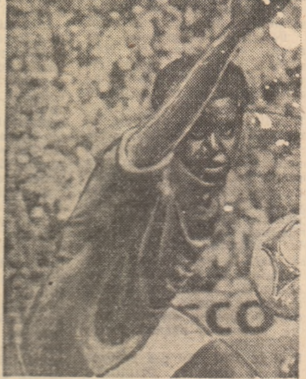
Trésor a înscris! Bucurialui e firească...

O ECHIPĂ SERIOASĂ, conectată la imperativele fotbalului competitiv, aptă să execute fără greșeală ambele „partituri” ale jocului actual, adică și momentul