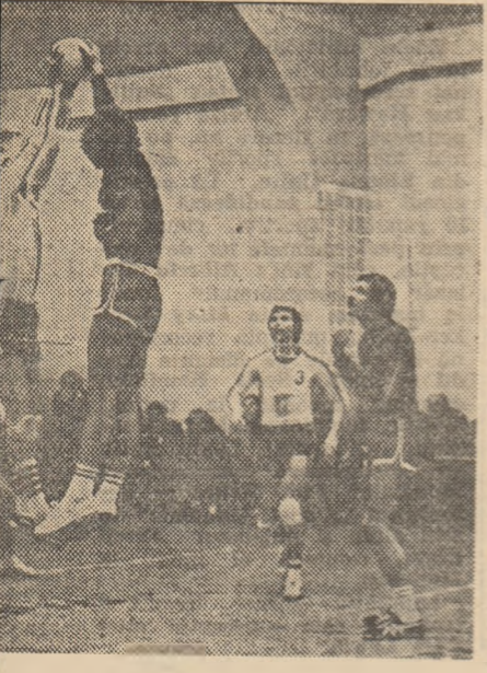
...ată de voleibaliștii de la Calculatorul și

...beș — A.S.S.U. Brașov ...Relo- artacus zău — Prahova ...orol II ești — a II-a: Electra — Vul- — Hune- a 0-3, M. Ca-