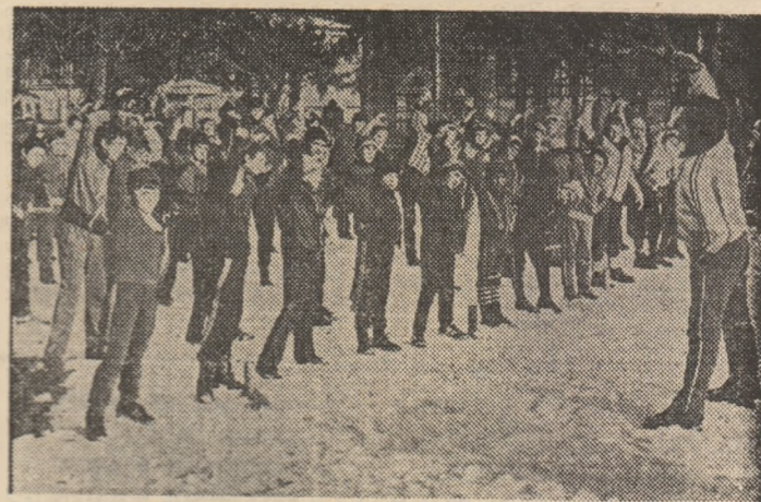
Ce plăcută și reconfortantă este gimnastica de dimineață! Mai ales în decorul splendid al Sinaiei, unde zăpada te îndeamnă ca după aceste minute de „încălzire” să pornești la drum, pe piriții de schi...