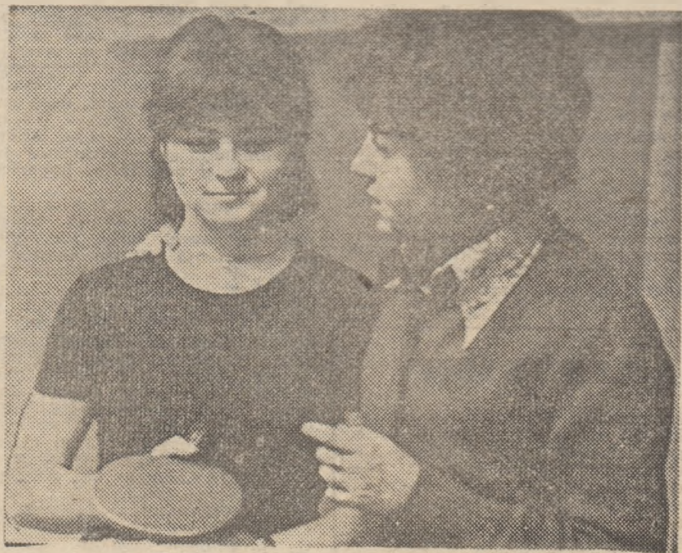
Un sfat la pauză, transformat în puncte în setul următor