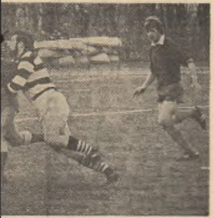
Holban) nu s-au putut descurca; Vin- „bloca” faza. (Sp. studențesc — Farul

sibieni TOMUȚA a reușit și el să eșue. (A. PETRICA, coresp.). GLORIA P.T.T. ARAD — POLITEHNICA 16 FEBR. CLUJ-NAPOCA 19-0 (15-0). Scăpați de grija jocurilor cu Steaua și Dinamo, arădenii își dispută fiecare meci cu gândul doar la victorie, singura lor șansă de a supraviețui în Divizia „A”. LECA a izbutit 4 drop-goaluri + l.p., GHIMIS — eșue. A arbitrat Șt. Crăciunescu, București. (L. IOANA, coresp.). ȘTIINȚA CEMIN BALA MARE — RAPID 19-0 (6-0). Gazdele mai bune pe înaintare și trei eșecuri au dominat net, meci ales după pauză. Bucureștenii fără transformare (Sigiș absent) au ratat cîteva l.p. Au marcat: ISTRATE — 2 eșecuri, PASCALE — eșue, CIOLPAN — 1 tr., BUCȘA — l.p. Arbitru: Fl. Dada, București. (A. CBIȘAN, coresp.). UNIVERSITATEA TIMIȘOARA — BULMENTUL BIRLAD 14-4 (14-0). Joc frumos cu faze dinamice. Timișorenii au înscris 3 drop prin COMĂNICI (min. 1, 17), 2 eșecuri prin PETER (min. 17), V. SUCIU (min. 37). Pentru oaspeți: DIMA — eșue (min. 14). A condus: Dr. Grigorescu, București. (C. CREȚU, coresp.). In clasament: 1. STEAUA 43 p. 2. Dinamo 42 p. (un joc mai mult), 3. Farul 38 p. (un punct penalizare), 4. Știința Petroșani 34 p. etc.