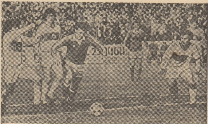
Georgău a pătruns hotărît în careu, unde va fi oprit cu pretul unui penalty