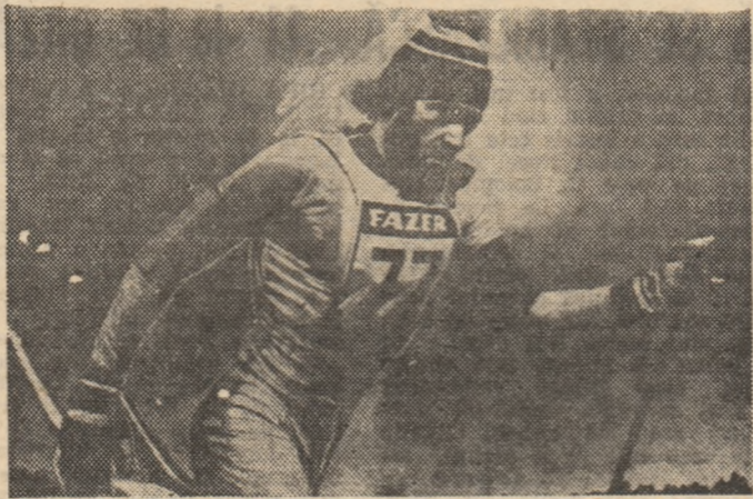
Suedezul Thomas Wassberg, unul dintre cei mai buni schiori-fondisti ai lumii, în timpul cursei de 50 km de la Lahti (Finlanda) pe care a câștigat-o recent.

Proba de perechi a campionatelor mondiale de patinaj artistic, care se desfășoară la Helsinki, a fost câștigată de cuplul sovietic Elena Valova — Oleg Vasiliev. Pe locurile următoare s-au clasat Sabine Baess — Tassilo Thierbach (R.D. Germană) fostii deținători ai titlului și Barbara Underhill — Paul Martin (Canada). După programul scurt, în proba individuală feminină conduce Rosalynn Summers (S.U.A.) urmată de Elena Vodnozova (U.R.S.S.) și Claudia Leistner (R.F. Germania). Campioana europeană Katarina Witt (R.D. Germană) ocupă locul 5. În proba de dans, după figurile impuse, primele trei locuri sunt ocupate, în ordine, de perechile: Jayne Torvill — Christopher Dean (Marea Britanie), Judy Blumberg — Michael Seibert (S.U.A.), Natalia Bestemianova — Andrei Bukin (U.R.S.S.).