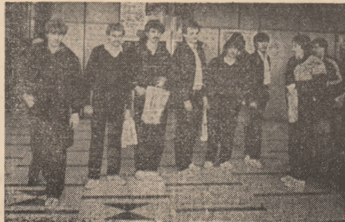
Internaționalul Briegel în mijlocul coechipierilor săi de la F.C. Kaiserslautern, la puțin timp după sosirea echipei vest-germane.

și sub toate raporturile. Fi-rește că pentru o partidă așa de echilibrată ca cea de acum, un rol esențial îl are factorul tactic. Tocmai de a-