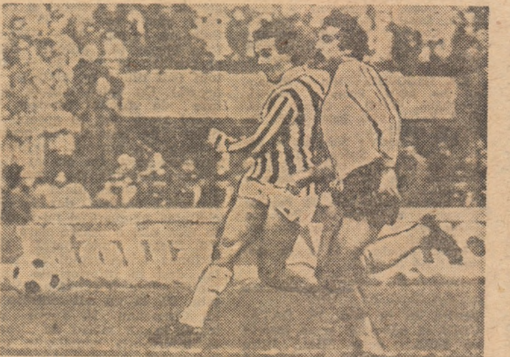
Michel Platini (cu tricou în dungii) — internațional francez — ultima mare vedetă a fotbalului italian, conducătorul de joc al noii sale formații, Juventus Torino.