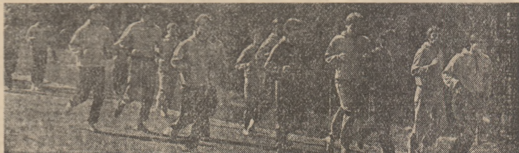
Luni, ora 9. Ultimul cros, ultima doză de oxigen pe drumul Polenei