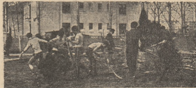
Stivuiri de la Lic. Ind. 1 dau o mîină de ajutor la înfrumusețarea cochetelor baze sportive de la Voinea

Pentru gospodarii oazelor sportive din municipiul Ploiești primăvara sau, mai bine zis, luna aprilie, intrată în tradiție drept „Luna amenajării și înfrumusețării terenurilor de sport”, a venit mai de mult. Și aceasta pentru că în august, anul trecut, analiza activității pentru dezvoltarea mișcării sportive prahovene, făcută în Biroul Comitetului Județean de partid, a avut un capitol aparte privind amena-