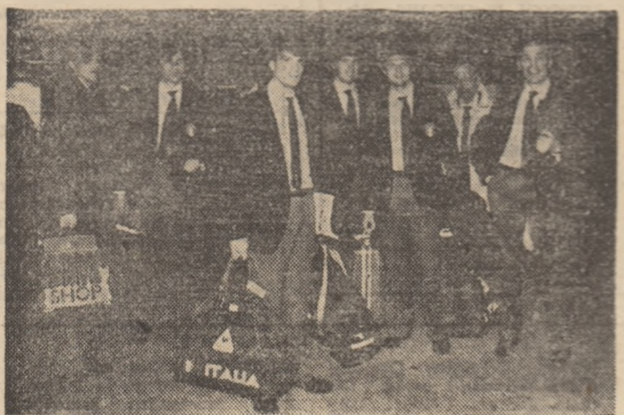
„Squadra azzurra”, cu antrenorul ei, Enzo Bearzot (primul din dreapta), la puțin timp de la sosire.

Echipa Italiei este de aseară la București. Reputația ei de „invincibilă squadra” la ultimul campionat mondial a atras la aeroportul internațional București-Otopeni un mare număr de iubitori ai fotbalului, dornici să-l vadă pe viu, cu 48 de ore mai devreme, pe renumiții jucători ai lui Enzo Bearzot.