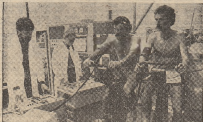
Școala superioară a sporturilor de la Köln este inezestrată cu laboratoare bine dotate cu aparatură modernă pentru testarea calităților fizice și a stării de sănătate a tinerilor sportivi. Iată un aspect dintr-unul din laboratoarele renumitei școli.

europene. În ceea ce privește formația iugoslavă, în ciuda faptului că nu mai are valoarea celei din anul '70, ea păstrează șanse la un loc frumos. Din punctul de vedere de atunci, în prezent numai Kikanović a rămas același realizator de excepție. Nu trebuie să subaprecieze nici șansele gazdelor și acestea nu numai pentru faptul că joacă pe teren propriu, ci mai ales pentru că în ultimul timp baschetul francez a progresat foarte mult, un exemplu în acest sens fiind victoria echipei Limoges în „Cupa Koraci”.