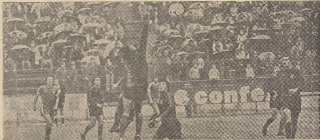
Intotdeauna un derby de mare atracție, partida Steaua — Dinamo a prilejuit și în turul campionatului (secvență din acel meci) o luptă pasionantă, încheiată la egalitate (1-1).

● Miză foarte importantă a derbyului: pentru Dinamo — menținerea într-o poziție favorabilă în lupta pentru titlu; pentru Steaua — un loc în „Cupa U.E.F.A.”! ● La Petroșani, Jiul nu mai vrea să „curgă” spre... vâlcu clasamentului ● La Tg. Mureș, față în față performerele etapei trecute ● Antrenorul tirgoviștenilor, C. Rădulescu, cunoaște bine secretele tactice ale băcăuanilor ● În „Regie”, studenții vizează „fotoliul de orchestră” ● La Rm. Vilcea, Chimia speră să-și mai adauge două puncte la activ, stopind contraatacurile lui Ciocă și Nemțeanu ● Noua echipă timișoreană în fața unui examen dificil ● La Ploiești, Mateianu și Coidum într-un duel pe muchie de cuțit ● Duminică, la Craiova, o partidă între internaționali craioveni și hunedoreni