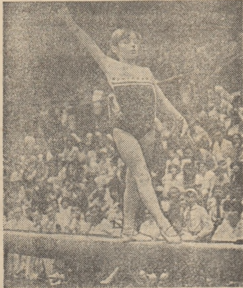
Ecaterina Szabo, una din favoritele competiției feminine

Astăzi după-amiază, în Sala sporturilor din Rm. Vilcea se vor inaugura Campionatele internaționale de gimnastică „Gheorghe Moceanu” ale României, întrecere tradițională, ajunsă la cea de-a 26-a ediție.