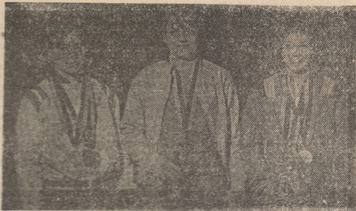
Gimnastele noastre medaliate — la sosirea pe aeroportul Otopeni.

Cînd au apărut, în fine, fetele au fost repede înconjurate de un grup numeros, de reprezentanți ai conducerii C.N.E.F.S., ai federației, ai unor cluburi, de familii, de gazetari sau simpli iubitori ai sportului, abia prîdind să mulțumească tuturor pentru cuvintele de felicitare, pentru flori. Pe Ecaterina Szabo am mai văzut-o întorcîndu-se cu medalii — de la „europenele” de juniori — dar parcă niciodată nu ni s-a părut atît de emoționată, trăgînd în răs-