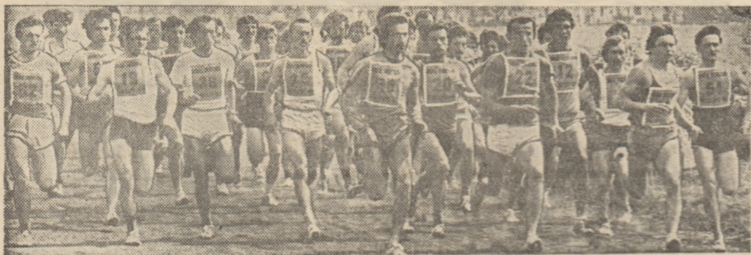
Aspect din cursa băieților de peste 19 ani.