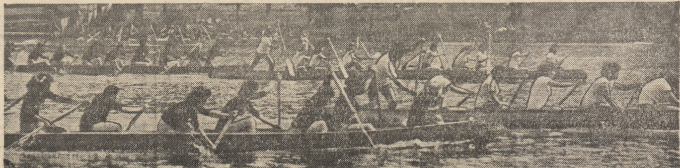
Curse animate, pe lacul Tei, în proba de canoie (foto) 10+1

În Capitală, la Complexul cultural-sportiv studențesc „Lacul Tei”, s-au desfășurat - sub egida marilor competiții naționale „Daciada” - întrecerile finale ale unei atrăgătoare regate din sportul de masă: Concursul republican universitar la canotaj și canoac-canoe, organizat de M.E.I., U.A.S.C.R. și Institutul Politehnic București, catedra de educație fizică și sport. (Citiiți rezultatele în pag. 2-3).