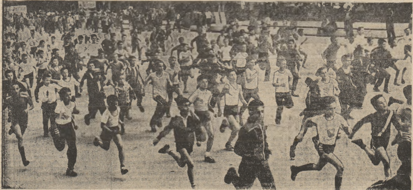
Crosurile de masă, una dintre cele mai eficiente forme de angrenare a tineretului în practicarea sistematică a sportului.

Sînt numai cîteva dintre obiectivele activității de educație fizică, care trebuie să stea în atenția și preocupările tuturor organizațiilor sportive și ale factorilor cu răspundere în sport, pentru ca, pretutîndeni, etapa de vară a competițiilor sportive naționale „Daciada” să se desfășoare la nivelul maxim al posibilităților în scopul valorificării în mult mai mare măsură a acestei activități, în favoarea care contribuie la dezvoltarea fizică armonioasă și păstrarea sănătății populației.