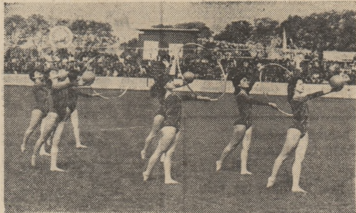
Gimnastica ritmică a cucerit, an de an, tot mai multe tinere din școli, întreprinderi și instituții