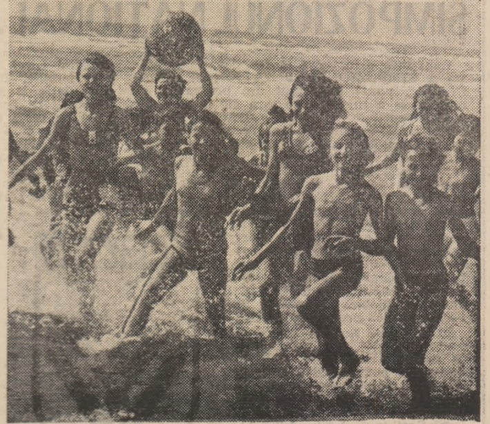
Apă, soare și bucuria de a trăi o copilărie fericită! Despre această vorbește și imaginea surprinsă de fotoreporterul nostru, Ion Mihăică, pe litoralul Mării Negre...

dinițe, în școli, în cluburile sportive școlare, la casele pionierilor și șoimilor patriei, în zone și parcuri special amenajate, copiii desfășoară o susținută activitate sportivă de masă, sub formă de jocuri de mișcare și de întreceri, prilej de bucurie, de multe satisfacții. Încercăm, în această pagină, să surprindem câteva aspecte legate de entuziasta prezență în sport a copiilor din patria noastră.