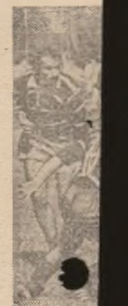
Steaua pregătește viitorul campionatului de fotbal