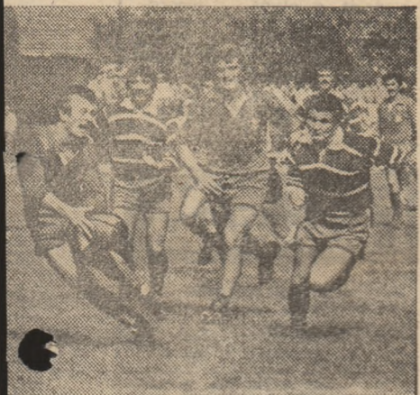
Prrijă ultimul său meci — decisiv — cu Gri- ai ales pe decizia liniei sale de atac. Cy cu apetit ofensiv.