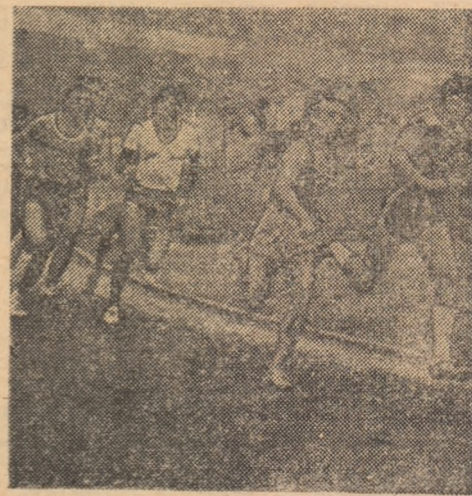
Inaintea finisului in proba de 800 m din cadrul pentatlonului atletice școlar

Timp de două zile, stadionul Duna din Galați a trăit din plin efervescența unei întreceri sportive de anvergură, gîzduind într-un cadru organizatoric demn de toată lauda finala pe țară a „Daciadei” la pentatlon atletice școlar. Pentru cei 410 elevi și eleve veniți din toate județele țării, cea de a 15-a ediție a acestui importante competiții sportive de masă a însemnat nu numai un bun prilej de a se afirma pe plan sportiv, reprezentînd cu cinste localitățile din care provin și județele lor, ci și de a-și manifesta grațitudinea pentru condițiile de învățatură și sport create de partidul și statul nostru. Intrecerea de la Galați a o-