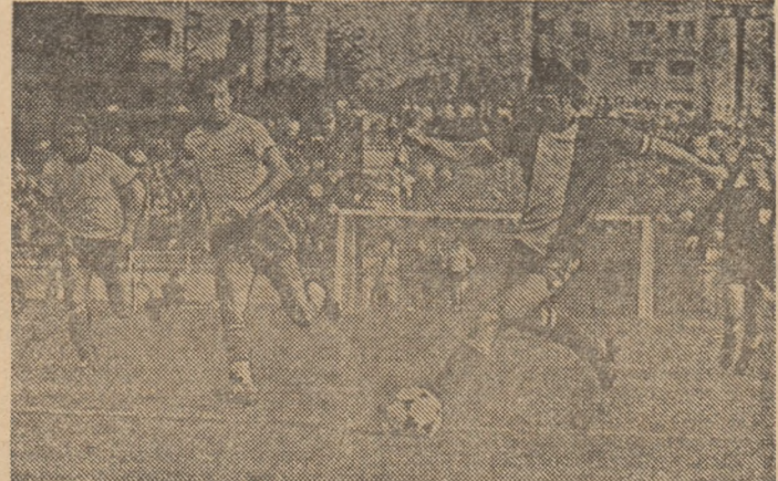
Stănescu, la minge, urmărit îndeaproape de cratoveanul Țicleanu. Fază din ultimul meci Dinamo — Universitatea, disputat în campionatul trecut.