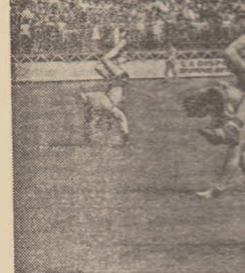
O secvență din demonstrația leapărilor prezentați la „Festivalul tinereții”...

Desfășurată în ambianța acri de plăcintă a complexului spor-