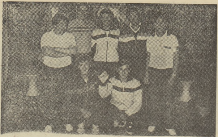
Delegația tenismanilor de la „Constructorul feroviar“

După prima participare la C.E. feroviar de tenis