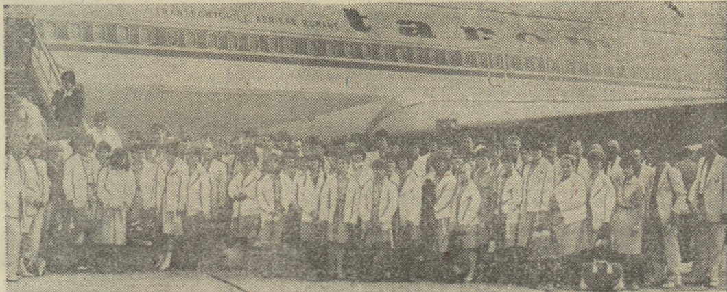
Grupul reprezentanților noștri la Universiada '83 înaintea imbarcării