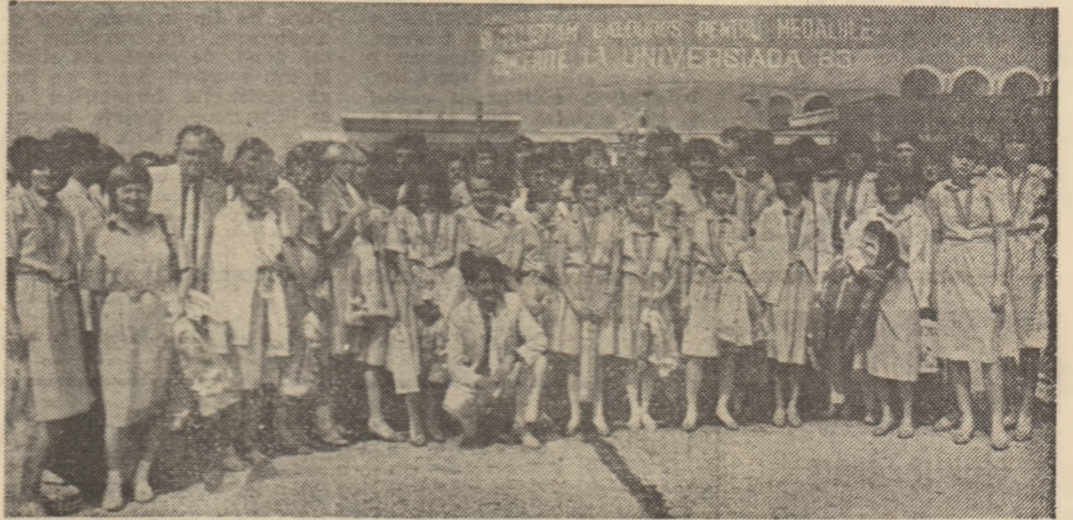
Sportivii noștri s-au înapoiat acasă cu medaliile Universiadelor '83 pe plepturi.

Întregii delegații i s-a făcut la aeroport o primire călduroasă, pe măsura performanțelor obținute