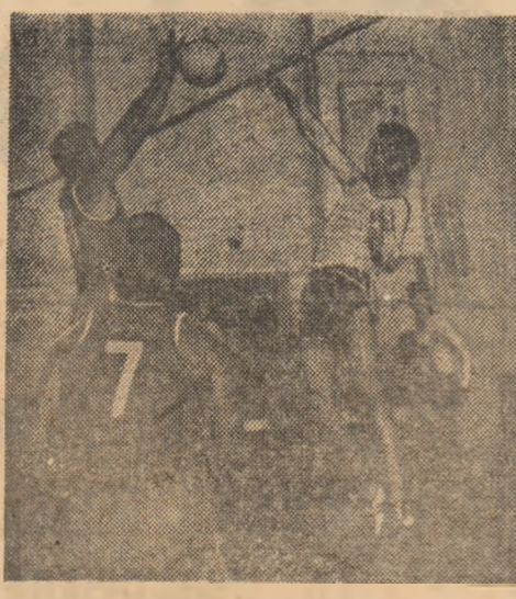
Fază din meciul de volei dintre I.J.C.M. Brăila și Grupul de șantiere Zalău