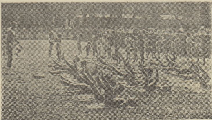
Primele lecții de inițiere a „delfinilor” încep pe uscat, așa cum ne demonstrează și această secvență de la Ștrandul tineretului...

pedagogic desăvîrșit. Firesc, pentru că nu este la îndemîna oricui să-l facă pe copil (încă de la 3 ani!) să-și înfrîngă teama de apă, să devină cuterător. Instructorii de la „Tineretului” se arată a fi, în această privință, pedagogi de excepție, în pofida faptului că între cei care activează aici de