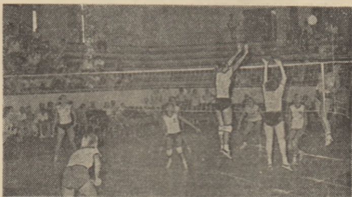
Sala sporturilor din Constanța va fi din nou gazda Turneului internațional feminin de volei al României dotat cu „Trofeul Tomis”. În imagine, o fază de joc dintr-o precedentă ediție a competiției.

la startul acestei ediții cîteva reprezentante ale voleiului mondial de elită, la loc de frunte între participante — alături de echipa României — situîndu-se selecționata R. P. Chineze, țară care deține de anul trecut supremația mondială, Cehoslovacia, cu care reprezentativa noastră își va disputa în principal, la Cottbus, șansa calificării în turneul final al C.E. 1983, Bulgaria, deținătoarea titlului european, și Polonia. De asemenea, mai participă la competiție formațiile R.F. Germania, Turciei și, după toate probabilitățile, cea de tineret a Cubei.