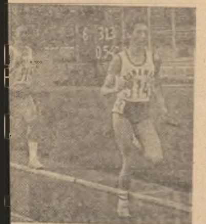
o mare speranță a atletismului

Calancea (România) 55,14; lungime : Viaceslav Babalievski ( Bulgaria ) 7,58 m; 2. Andrej Marinkovic (Iugoslavia) 7,50 m; 3. Daniel Petkov (Bulgaria) 7,30 m; 4. Michael Filandarakis (Grecia) 7,26; 5. Gabriel Băra (România) 7,22 m; 6. Tomo Rugelj (Iugoslavia) 7,16 m; disc : Stelică Turbă (România) 53,30 m; 2. Valeri Ciudomirov (Bulgaria) 52,20 m; 3. Petto Kramouski (Bulgaria) 51,06 m; 4. Andor Nachairas (Grecia) 50,24 m; 5. Igor Primic (Iugoslavia) 49,64; 6. Christos Papadopoulos (Grecia) 47,46 m; prăjină : Nikolai Nikolov (Bulgaria) 4,80 m; 2. Ștefan Stoi-