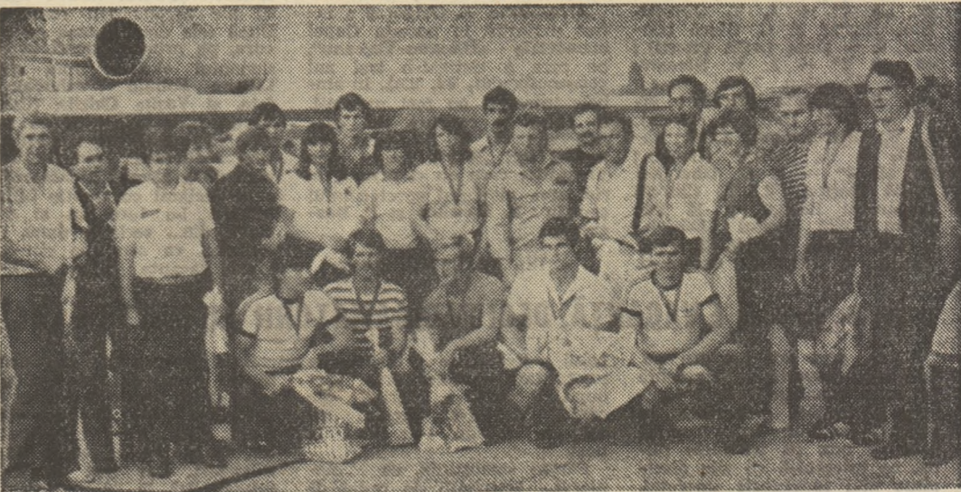
Cu medaliile pe piepturi și florile prețurii în brațe la înapoierea acasă

Caiaciștii și canoieștii medaliați dedică succesele lor marii sărbători naționale a poporului român