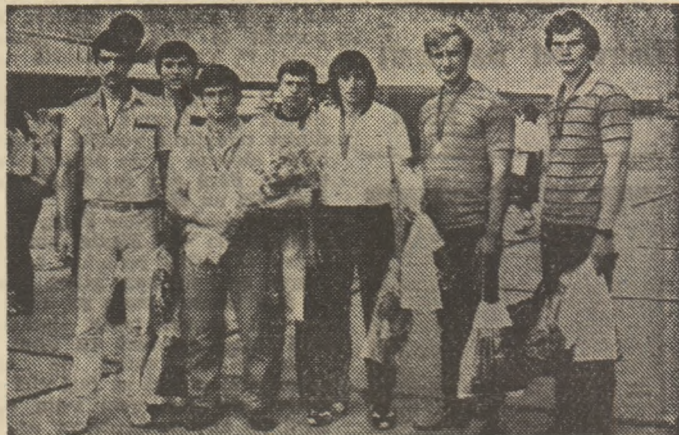
Ei sînt sportivii care au adus României medaliile de aur de la campionatele lumii!

OMOLOGAREA REZULTATELOR JOCURILOR DISPUTATE ÎN EDIȚIA 1982-1983 A CAMPIONATELOR REPUBLICANE DE FOTBAL ȘI PROGRAMUL TURULUI CAMPIONATULUI DIVIZIEI „A”, EDIȚIA 1983-1984. (ÎN PAG. 4-5).