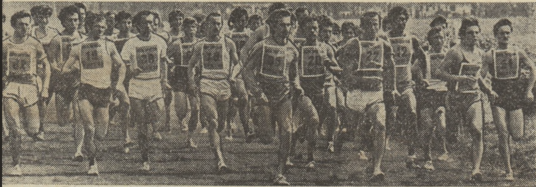
Tinerețe, vigoare, dorință de victorie...