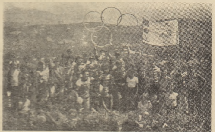
O parte din competitorii la prima ediție a Cupei Satului Olimpic