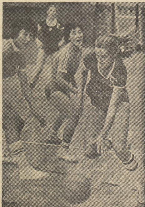
Atac al echipei U.R.S.S. împotriva apărării în zonă a selecționatei R.P.D. Coreene.