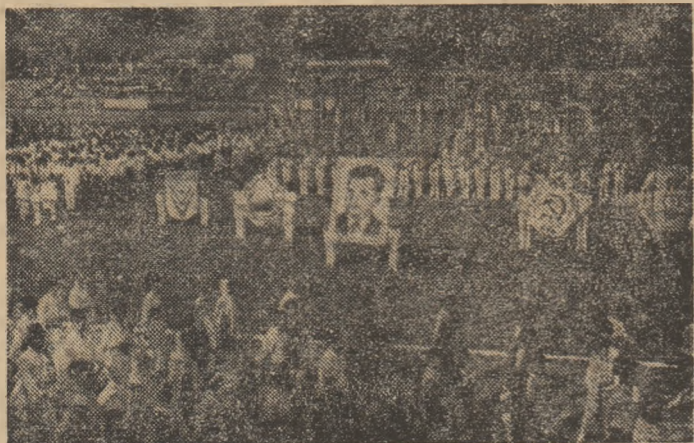
O imagine de la deschiderea întrecerilor „Cupei C.U.A.S.C.” găzduită de stadionul 23 August din Rm. Sărat.

P.C.R. și desfășurată sub semnele „Dacladel”, a cunoscut un real succes. La startul întrecerilor au fost prezenți aproape 1500 de sportivi și sportive, cel mai bun dintre cei care au luat parte la această frumoasă acțiune, încă de la prima etapă, peste 15000 de tineri și tinere, din toate cele 14 consilii agroindustriale ale județului.