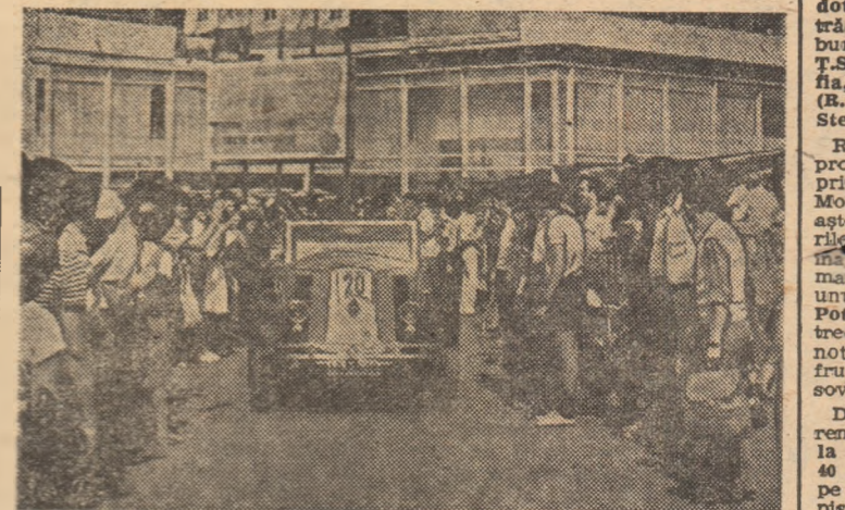
Se îndreaptă spre linia de start un „Renault” din anul 1928...

CLUJ-NAPOCA, 23 (prin telefon). Desfășurate de cîțiva ani după o formulă inedită, întrecerile finale ale campionatelor naționale de oină au început vineri dimineață pe stadionul municipal din localitate. Dintre sutele de participante la etapa inițială echipele Dinamo București (actuala campioană a țării), C. P. București, Universitatea București, Energia Rîmnicele (jud. Buzău), Tineretul Crîngu (jud. Teleorman), Laminorul Roman, Tricolorul B. Mare, Recolta Apoldu de Sus (jud. Sibiu) Metalul Tîrgoviste și Dinamo Tulcea au reușit, mergînd din victorie în victorie pînă în prezent, să se mențină în luptă pentru un loc pe podium disputîndu-și acum înțietatea, în primul tur al finalei pe tară. Într-un turneu eliminatîriu la capătul căruia duminică la prînz vor mai rămîne doar 4 echipe în cursa pentru titlu. Sortii au decis ca în cel mai important joc al reuniunii inaugurale să se întinsec fosta campioană a țării C. P. București și Laminorul Roman. Tipografi au început la „bătăia mingii” unde au realizat 8 puncte suplimentare. În schimb cu evidente fisuri în apărare, majoritatea bucureștenilor au fost loviți — pe culoarul de conducere sau întoarcere — fiind conduși după prima repriză la o diferență apreciabilă: 18:8. Pauza a fost un bun sfetnic pentru fostii