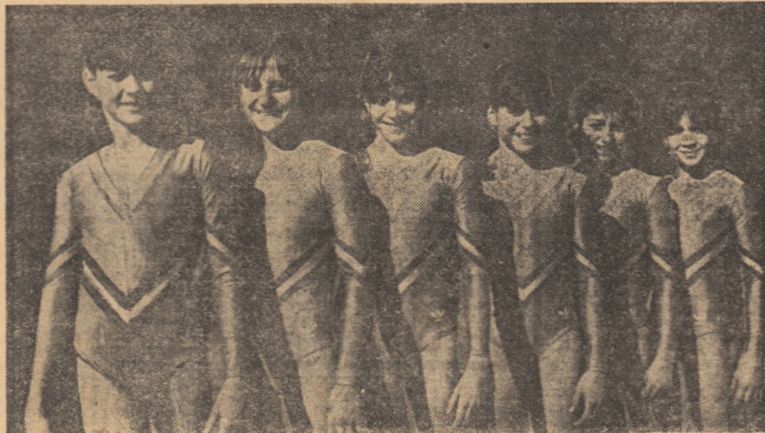
Echipa României, vicecampionă a lumii: Mirela Barbălată, Mihaela Stănuț, Camelia Renciu, Lavinia Agache, Ecaterina Szabo, Laura Cutina.

● Frumoase speranțe în continuare: Lavinia Agache, Ecaterina Szabo și Laura Cutina - între primele 10 pentru individual compus, șapte prezențe în finalele pe aparate ● Titlul a revenit formației U.R.S.S.