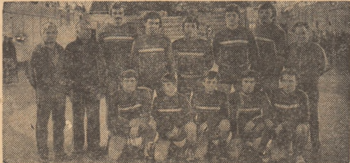
Echipa de lupte greco-romane a clubului Dinamo București — clasată pe primul loc, cu 64 de puncte.

Un plăcut „sfârșit de stagiune”, turneul final pe categorii de greutate, desfășurat timp de două zile în sala Dinamo din Capitală, a reunit, cu o singură excepție — Constantin Uță, accidental în preziua competiției — tot ce există mai valoros, la această oră, în sportul luptelor greco-romane din țara noastră, unele absente (de ce, totuși?...), neinfluențând nici calitatea întrecerilor, nici noile ierarhii stabilite cu acest prilej.