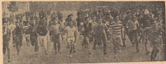
Aspect de la finala pe țară a „Crosului tipografilor”

Ca în fiecare an, cei care dau lumina tiparului milioanei de cărți, ziare și reviste și-au trimis cîștigătorii fazei pe întreprindere pe traseul final din jurul „Casei Școlii”. Cursele rezervate juniorilor (1 000 m) și juniorilor (2 000 m) au revenit, scontat, viitorilor tipografi — elevilor de la Liceul industrial poligrafic nr. 16 din Capitală. Ambitioși talentați și bine pregătiți de un harnic și competent colectiv de profesori de educație fizică, școlarii de la