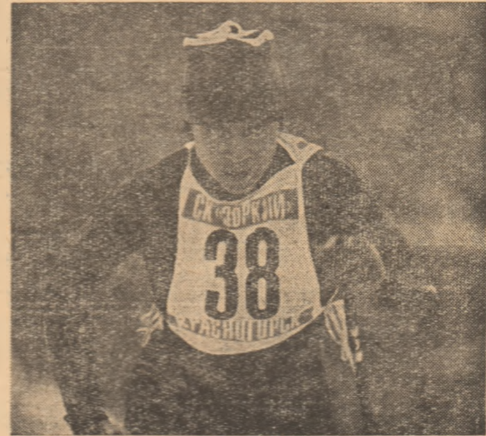
Raisa Smetanina, una dintre cele mai valoroase schioare fondiste din lume, își pregătește cu asiduitate participarea la „Olimpiada Albă“ de la Sarajevo.

● PORTUGALIA (et. 8): Penafiel — Benfica 0—3, Boavista — Agueda 4—1, Farense — Porto 0—2, Varzim — Braga 2—0, Espinho — Rio Ave 2—3, Guimaraes — Setubal 3—4, Sporting — Portimense 3—0, Salgueiros — Estoril amint. Clasamentul: 1. Benfica Lisabona 15 p., 2. F.C. Porto 14 p., 3. Sporting Lisabona 11 p., 4. Guimaraes 11 p., 11. Salgueiros 4 p. (7 j), 15. Agueda 4 p., 16. Espinho 2 p.