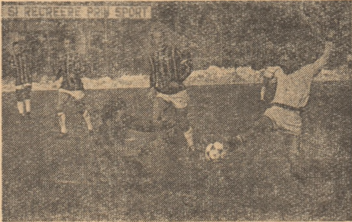
Bucu a fost mai rapid decît... rapidistul Damaschin și bucureștenii au irosit încă o ocazie.

În nota forței lor de joc, victoria craiovenilor la Galați (a