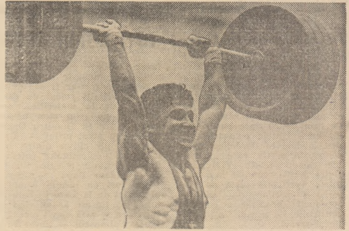
Dragomir Cioroslan, unul dintre cei mai buni halterofili ai lumii (locul 4 la C.M. și locul 5 la „Cupa Mondială”), în imagine el „aruncă” 200 kg!

— La „Cupa Mondială”, pe baza unor rezultate anterioare de valoare, sint invitați de obicei mai mulți concurenți. Inițial s-a stabilit ca în program să figureze un serial de 10 concursuri în acest an și care să puncteze în clasamentul competiției, dar, ulterior, federația internațională de specia-