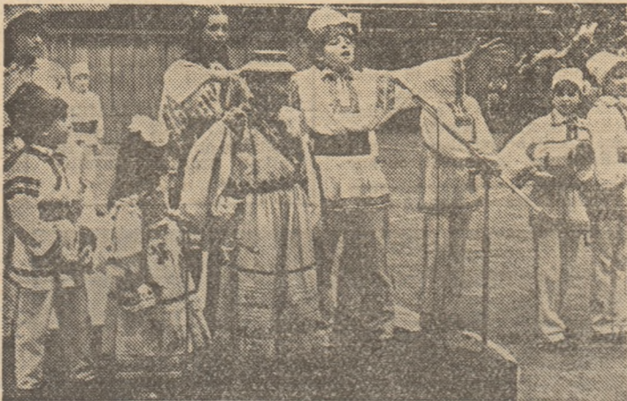
Grupul de copii de la Clubul sportiv școlar nr. 2 și Casa Pionierilor și Școlilor Patriei a sectorului 2, care au prezentat „Plugușorul olimpicilor”, au fost îndelung aplaudați.