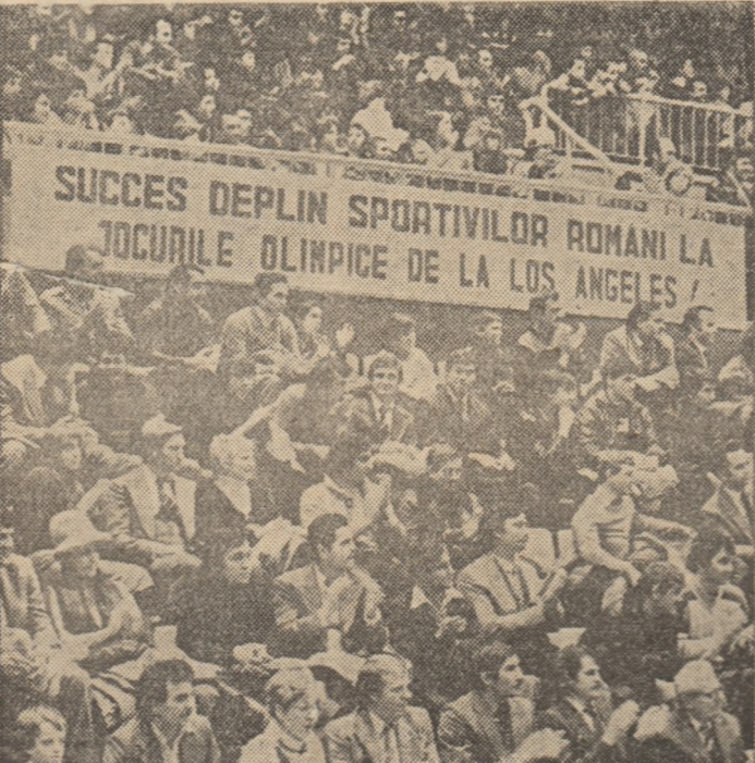
Spectatorii prezenți ieri la Palatul Sporturilor și Culturii, mari iubitori ai sportului, și-au manifestat dorința unanimă de a vedea pe performerii noștri obținând noi succese olimpice în anul viitor.

Festivitatea de inminare de trofee, cupe și diplome frunțașilor sportului românesc a prilejuit ieri dimineață, la Palatul Sporturilor și Culturii, un spectacol inedit, emoționant și angajat pentru marele examen al Jocurilor Olimpice din anul 1984