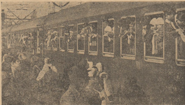
...Sintem în Gara de Nord. Pleacă copiii în vacanță