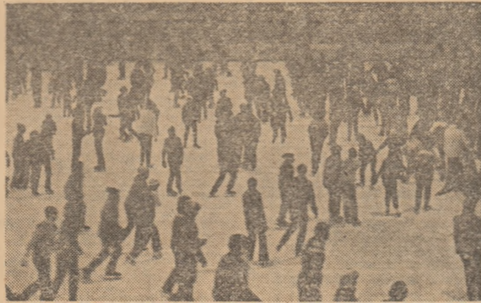
Animatie continuă și, bineînțeles, multă voie bună pe patinoarul artificial din Suceava, în fiecare din aceste zile ale vacanței de iarnă