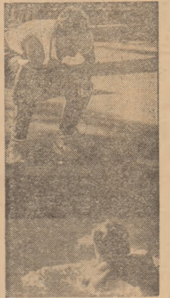
Campionul european și mondial vest-germanul Michael Gross (în fotografie) și-a propus să câștige un titlu olimpic la Jocurile de la Los Angeles. În prezent, împreună cu colegii săi de echipă, Gross participă la un stagiu de pregătire la Industry Hills în California, cea veșnic însoțită.