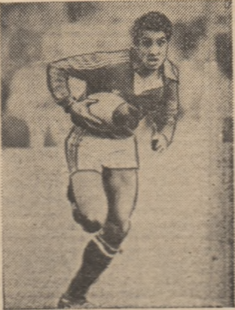
Fundașul Serge Blanco a fost socotit „rugbyistul nr. 1 al anului 1983”. El rămîne principalul atu al echipei Franței și în actuala ediție a Turneului celor 5 națiuni...

considerare esaverajul. Primul succes a suris Angliei (1910), al doilea Țării Galilor (1911), apoi din nou englezilor, care-și continuă seria pînă la primul