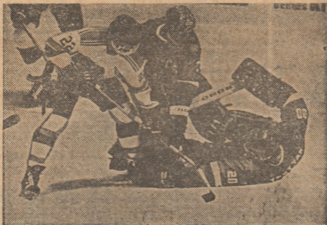
Vladislav Tretiak este un adevărat „înger păzitor” pentru poarta echipei sale, campioană a lumii. Anul trecut el a fost declarat cel mai bun hocheist din Uniunea Sovietică.

mul celor 13 ediții ale Jocurilor Olimpice de iarnă desfășurate pînă acum. Iată un clasament al titlurilor câștigate: 1-2. Canada și U.R.S.S., câte 5 victorii fiecare, 3. S.U.A., 2. 4. Marea Britanie 1.