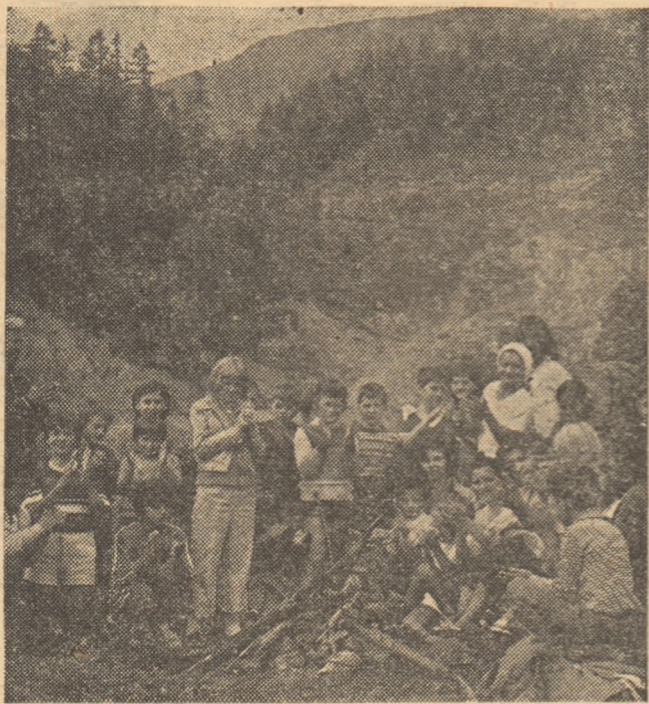
Excursiile, drumețiile organizate cu elevi reprezintă o formă deosebit de eficientă de cunoaștere a frumuseților patriei, a tot ce se găsește în țară, în acești ani luminoși ai socialismului