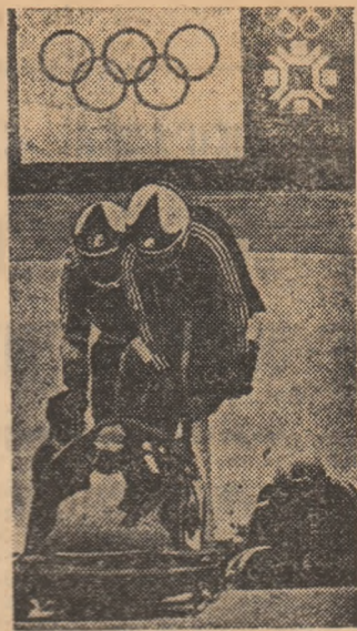
Pe „scocul” de gheață de la Trebević, antrenamentele boburilor se desfășoară non-stop.

Marți vor intra în concurs hocheistii (avanpremiera!), după un program care se va încheia aproape de miezul nopții, miercuri va avea loc festivita-