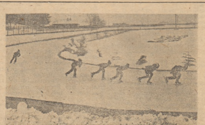
De cum se luminează și pînă la căderea întinericului pe pista de patinaj viteză de la Miercurea Ciuc se desfășoară activitate non-stop. Gheața este excelentă, iar de frig... nu se plinge nimeni.