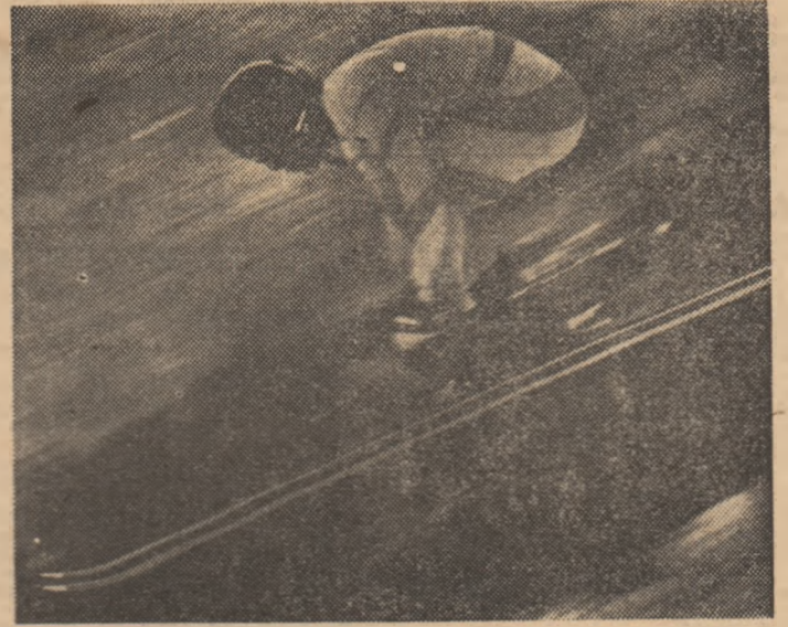
Bill Johnson (S.U.A.) a cucerit o meritată victorie în proba de coborîre bărbați.