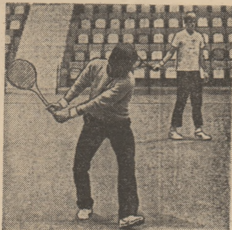
Jimmy Connors, cu necrușătoarea lui lovitură cu ambele mîini