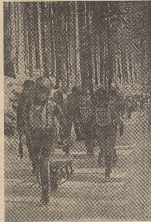
Cu emoții, dar și cu ambiție, urcînd spre locul de start al concursului de sanie

Vatra Dornei și-a consacrat calitatea de gazdă ospitalieră a competițiilor în sporturile de iarnă. O gazdă care își primește în fiecare an oaspeții cu nămeți de zăpadă, cu pîrții excelent amenajate pentru schi și sanie... Zilele trecute l-au fost oaspeții sute de copii din toată țara, care și-au disputat înfrîntărea în „Cupa Pionierul” la schi (probe alpine), biatlon și sanie, competiție de amploare desfășurată în cadrul „Dacia”. O întrecere care s-a bucurat de o remarcabilă organizare asigurată de Consiliul Național al Organizației Pionierilor, în colaborare cu Ministerul Educației și Învățămîntului, C.N.E.F.S., precum și cu factorii locali.