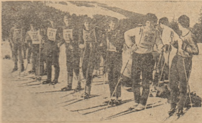
Pe platoul „grădinei Oncești“ din Păltiniș a doua serie a biatloniștilor de la categoria 18-20 de ani este gata de start