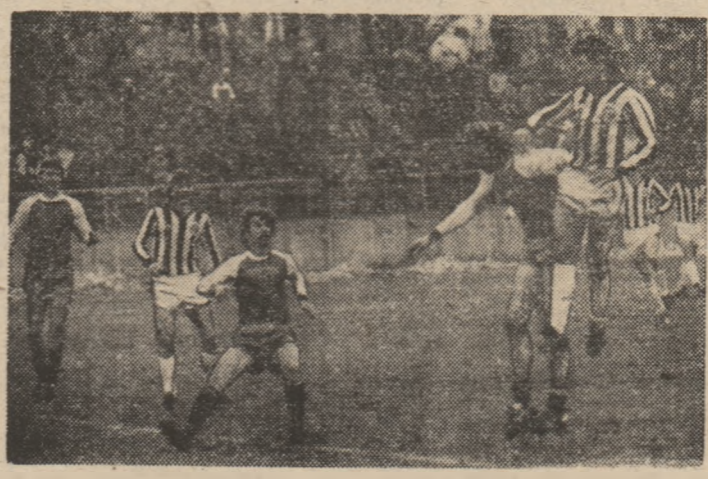
Hagi, surprins în meciul cu F.C. Bihor, unul din jocurile lui foarte bune din acest sezon...