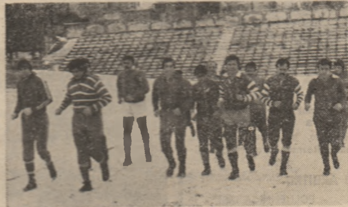
Pe frig, încălzirea se face cu mai mare plăcere.

Meciu amical cu Sportul studentesc e incins, ca un meci oficial. Pentru Dinamo, campionatul a început cu o săptămînă mai devreme... Dimitrie CALLIMACHI