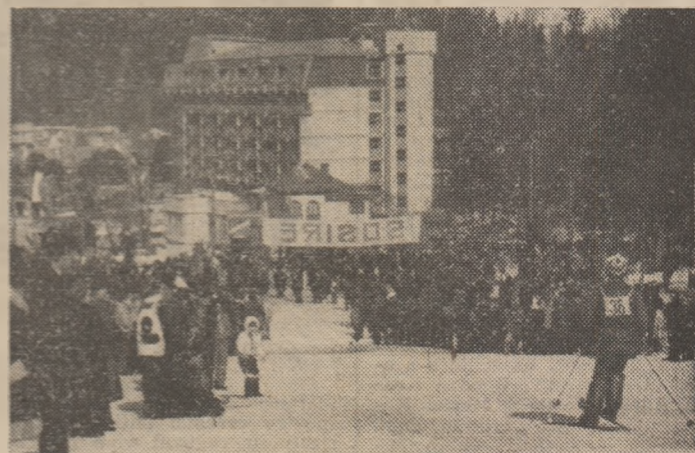
Suporteri mulți la Vatra Dornei, la întrecerile de schi alpin din cadrul „Cupei U.G.S.R.”

După șase ani, la C. S. Ș. „Cetate” Deva: