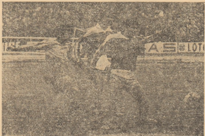
Mateuș șutează și înscrie al doilea gol al „tricolorilor” în meciul de ieri