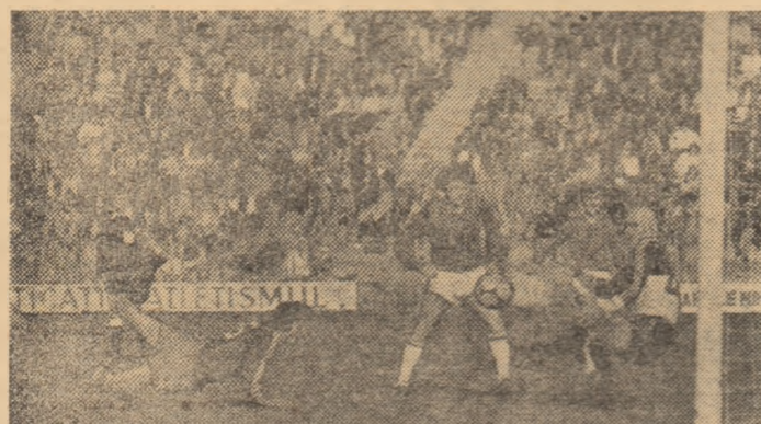
Una din numeroasele ocazii vâlcene la poarta lui Naste: mingea reluată cu capul, din plonjon, de Buduru, va fi respinsă de portarul mureșean, Fază din meciul Chimia Rm.Vilcea - A.S.A. Tg. Mureș (2-1)

șasca etapă în care ploieștenii nu pierd, de data aceasta la Olt, unde FL. Halagian s-a cam specializat în „remize”, capitol la care - cu 11 rezultate de egalitate - deține recordul Diviziei „A”. În Regie, Politehnica Iași a făcut clipe grele colegilor bucureșteni, salvați, în cele din urmă, de golul lui Iorgulescu, care a trebuit să alerge între un careu în care Speriatu greșea ca un copil și celălalt careu, în care supăra o sterilitate greu de așteptat din partea unor jucători care se numesc: Mircea Sandu, Coras, Hași (ce bine au jucat ultimii doi miercuri, la Bologna!), FL. Grigore sau Terheș, o mare speranță cind juca la Baia Mare. La Petrosani, F. C. Argeș suferă a doua înfrângere din retur, iar la Baia Mare S. C. Bacău, mai oscilantă ca oricind, de la 3-0 cu Steaua vine la un 0-4 (și nu e primul) sec și fără explicații, lipsa portarului Măngeac nefiind o scuză pentru ceilalți. Sub raportul eficacității, etapa a 25-a a fost satisfăcătoare (2,55 media de goluri pe partidă), dar rămânerea în „bloc-starturi” a unor golgeteri (a