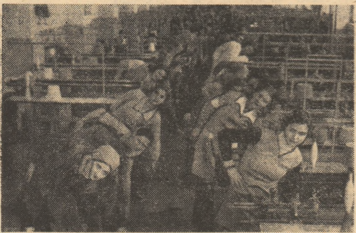
Momente de destindere, sănătate și întărire a capacității de muncă la o unitate a Cooperativei Voința din Capitală